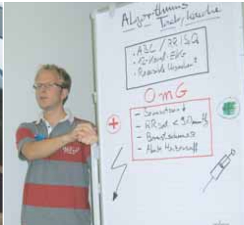
Workshops: Die Teilnehmer erarbeiten Inhalte im Team, häufig anhand eines Fallbeispiels