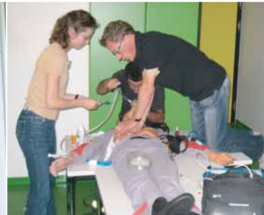
CAST (Cardiac Arrest Simulation Training): Das eigentliche Reanimationstraining erfolgt an Megacode-Puppen

Teilnehmern und Ausbildern während des Kurses das „Du“. Titel und Positionen außerhalb des ERC-Kurses spielen während dieser Zeit keine Rolle. Auf den ERC-Namensschildern stehen lediglich der Vorname groß und der Nachname klein geschrieben.