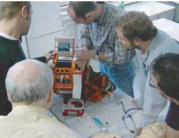
Skill-Stations: Einzelne Prozeduren der Reanimation werden gemeinsam geübt